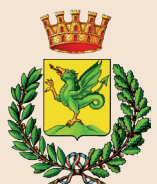
COMUNE DI MELFI