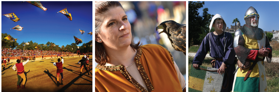
1° Premio - E. Bonelli