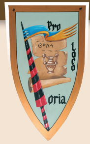
ASS. TURISTICA PRO LOCO - ORIA