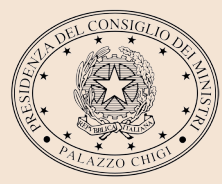
PRESIDENZA DEL CONSIGLIO DEI MINISTRI ALTO PATROCINIO