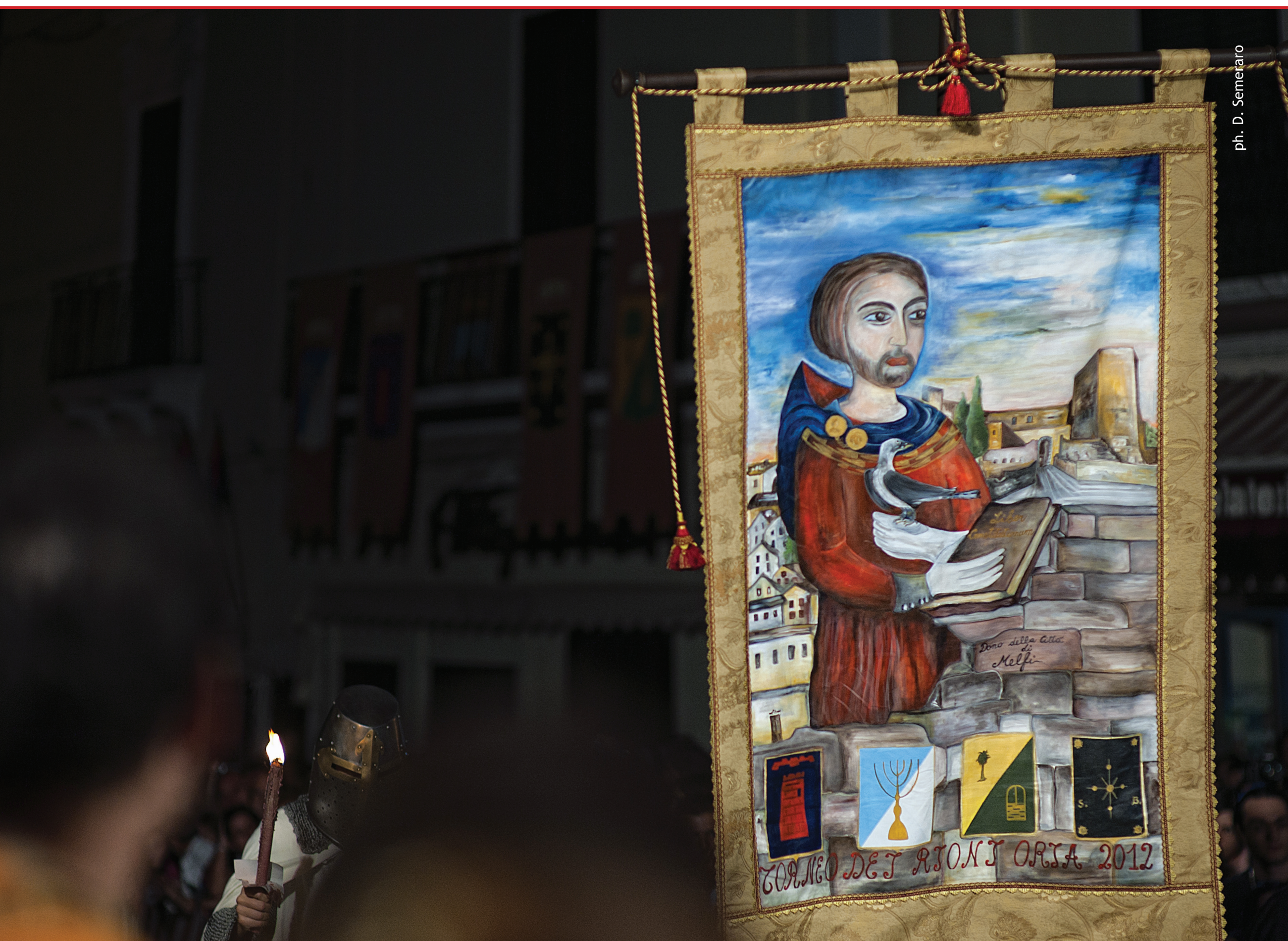
ph. D. Semeraro