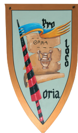
ASS. TURISTICA PRO LOCO - ORIA