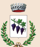
COMUNE DI NOVOLI