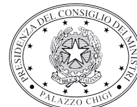
PRESIDENZA DEL CONSIGLIO DEI MINISTRI ALTO PATROCINIO