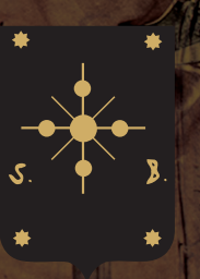
Rione San Basilio